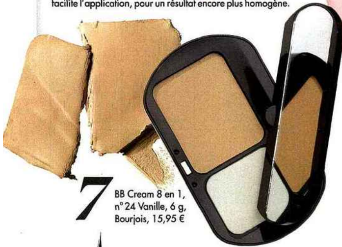
7 BB Cream 8 en 1, n°24 Vanille, 6 g, Bourjois, 15,95 €