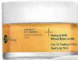
Masque de nuit Éclat Carotte, Dr. Renaud 33,90 €

Stress, fatigue, pollution rendent le teint gris. Pour retrouver son éclat et une mine défatiguée, on mise sur les masques de nuit, à utiliser en cure ou ponctuellement.