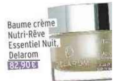
Baume crème Nutri-Rêve Essentiel Nuit, Delarom 82,90 €