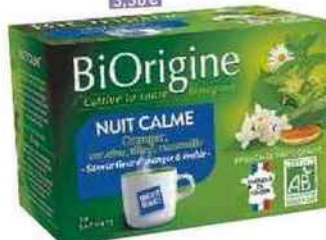
Infusion Nuit calme, BiOrigine 3,36€

De savants mélanges de mélisse, tilleul, valériane pour apaiser l'esprit et aider à l'endormissement... et/ou de verveine, réglisse et fenouil pour favoriser la digestion et passer une nuit sereine!