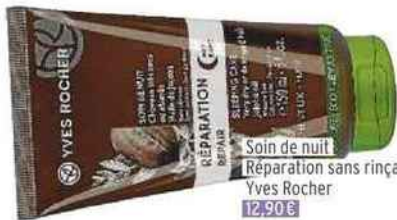
Soin de nuit Réparation sans rinçage, Yves Rocher 12,90 €