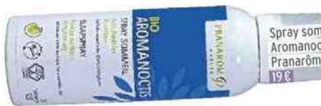
Spray sommeil bio Aromaoctis, Pranarôm 19€