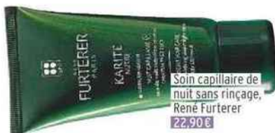
Soin capillaire de nuit sans rinçage, René Furterer 22,90 €