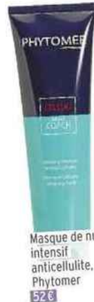
Masque de nuit intensif anticellulite, Phytomer 52€