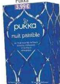
Infusion Nuit paisible Pukka 3,99€