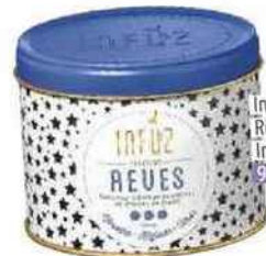
Infusion Réves, Infuz 9,90€