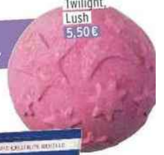
Bombe de bain Twilight, Lush 5,50€

Pour une nuit paisible, massez-vous chaque soir... avec une huile ou une crème pour nourrir intensément la peau, ou avec un produit amincissant pour s'affiner en dormant.