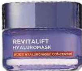
Masque de nuit Revitalift Filler Hyaluromask, L'Oréal Paris 17,90 €