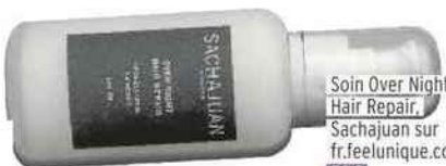
Soin Over Night Hair Repair, Sachajuan sur fr.feelunique.com 53 €