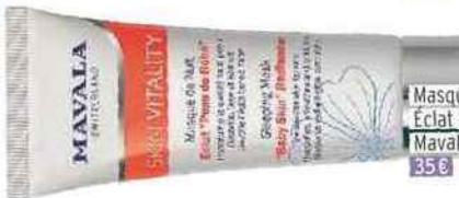
Masque de nuit Éclat "Peau de Bébé", Mavala 35 €