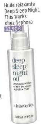
Huile relaxante Deep Sleep Night, This Works chez Sephora 32,90€