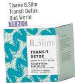
Tisane B.Slim Transit Detox, Diet World 39,80€