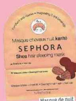
Masque de nuit karité à rincer, Sephora 3,95 €

À choisir sans rinçage pour les plus pressées ou à rincer pour les chevelures très abîmées, ces soins de nuit assurent huit heures de nutrition intense pour des cheveux réparés et brillants.