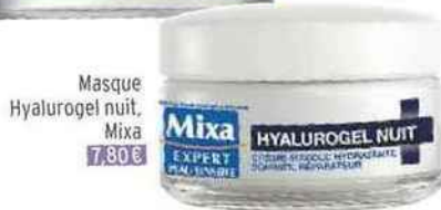
Masque Hyalurogel nuit, Mixa 7,80 €