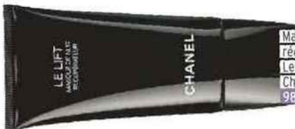
Masque de nuit récupérateur Le Lift, Chanel 98 €