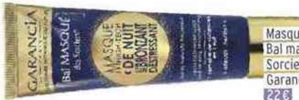
Masque de nuit Bal masqué des Sorciers autobronzant, Garancia 22 €