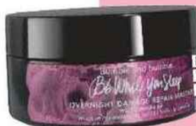
Masque réparateur de nuit While You Sleep à rincer, Bumble and bumble 42 €