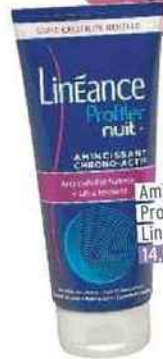
Amincissant Profiler nuit +, Linéance 14,90€