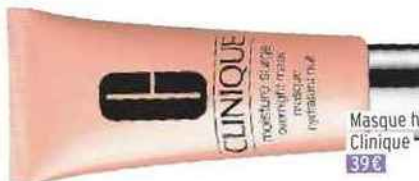
Masque hydratant nuit, Clinique 39 €